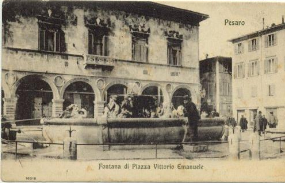
14 Pesaro - Fontana di Piazza Vittorio Emanuele ED. ? 10013 BR V.905 ca.