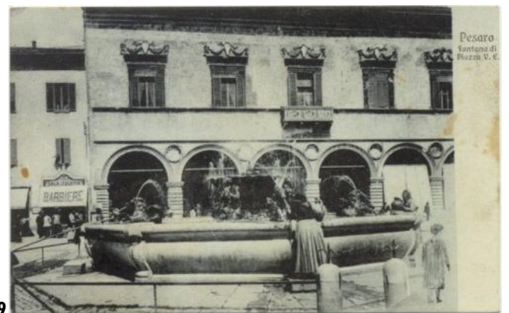
19 PESARO - Fontana di Piazza V. E. ED. Della Chiara AZ V.911