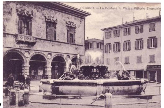
17 PESARO - La Fontana in Piazza Vittorio Emanuele ED. Moscatelli 125 BN N