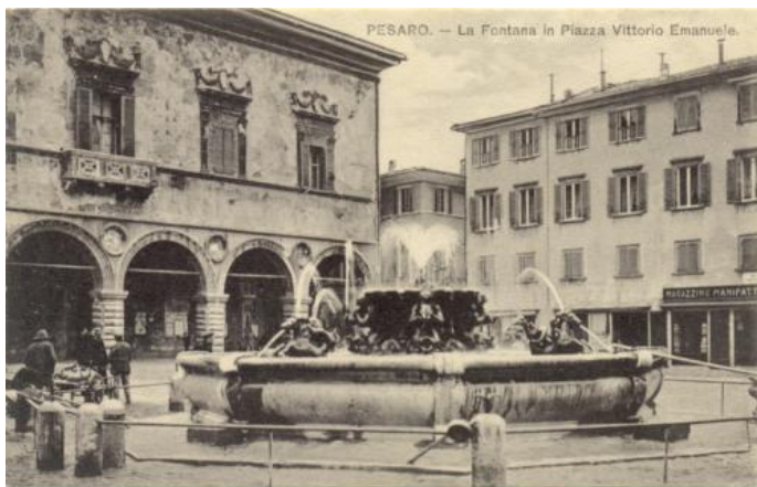
17 A PESARO - La Fontana in Piazza Vittorio Emanuele ED. Moscatelli 125 BN N