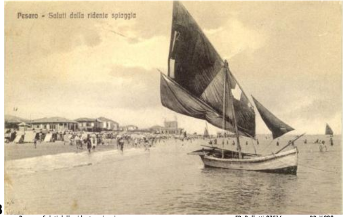
1778 Pesaro - Saluti dalla ridente spiaggia ED. Bellotti 97516 BR V.922