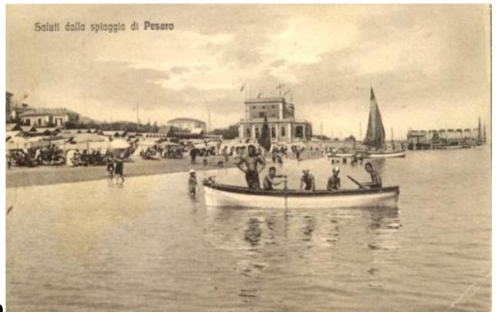
1780 Saluti dalla spiaggia di Pesaro ED. Carboni 97492 BR V.927 A Pesaro - Kursaal e spiaggia ED. A.C. 97492 BN V.931