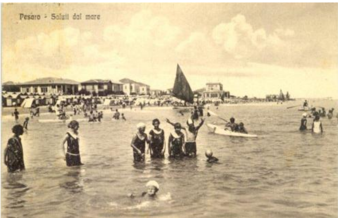
1779 Pesaro - Saluti dal mare ED. A.C.212 - 101640 BR V.930