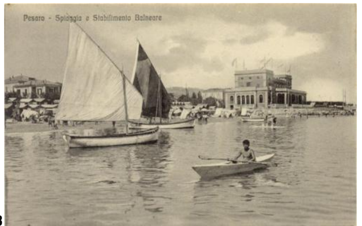
1783 Pesaro - Spiaggia e Stabilimento Balneare 97485 BN N A Pesaro - Spiaggia e Stabilimento Balneare ED. A.C.212-97485 BN V.931