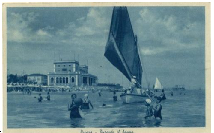
1785 Pesaro - Durante il bagno. ED. B.M.R. AZ V.943