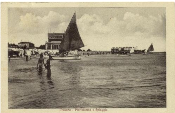
1782 Pesaro - Piattaforma e Spiaggia ED. A.C. 212 BN V.931