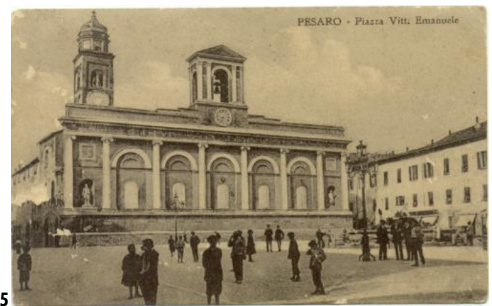
135 PESARO - Piazza Vitt. Emanuele ED. ? BN V.917