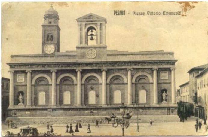
132 PESARO - Piazza Vittorio Emanuele ED. Semprucci 2388 BR V.913