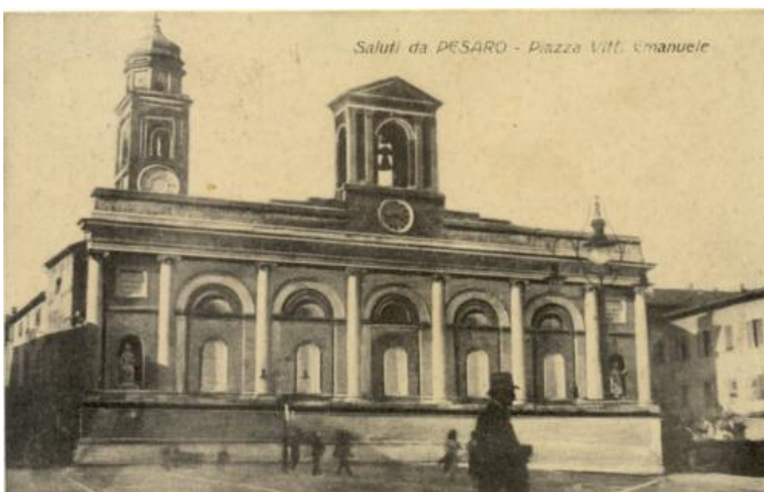
134 Saluti da PESARO - Piazza Vitt. Emanuele ED. Rovagnani 3122 BN V.917