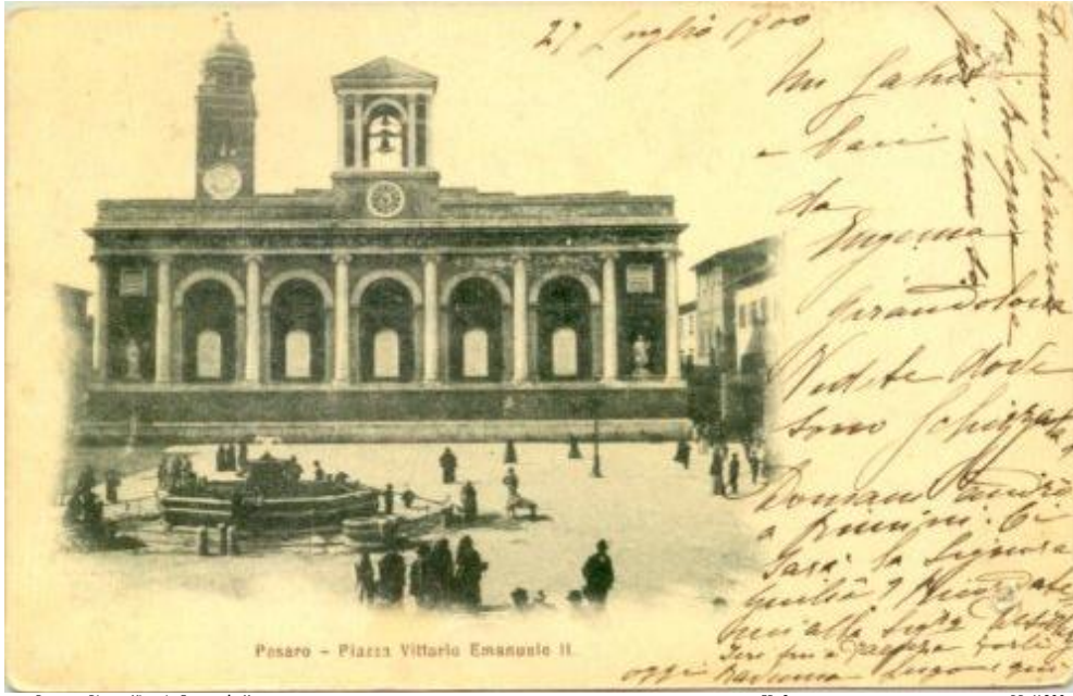
130 Pesaro - Piazza Vittorio Emanuele II ED. ? BR V.900

1962 la facciata viene restaurata a seguito dei danni subiti dall'ultima guerra