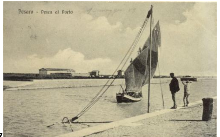
Pesaro - Pesca al Porto