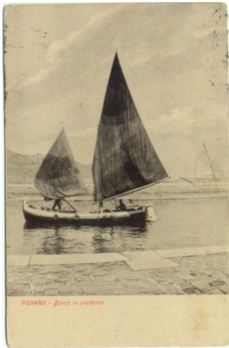
PESARO - Barca in partenza

ED. Bellotti 38713-3893 AZ V.931 ED. Bellotti 38713-2666 AZ N ED. Sternfeld 38713-3404 AZ V.930