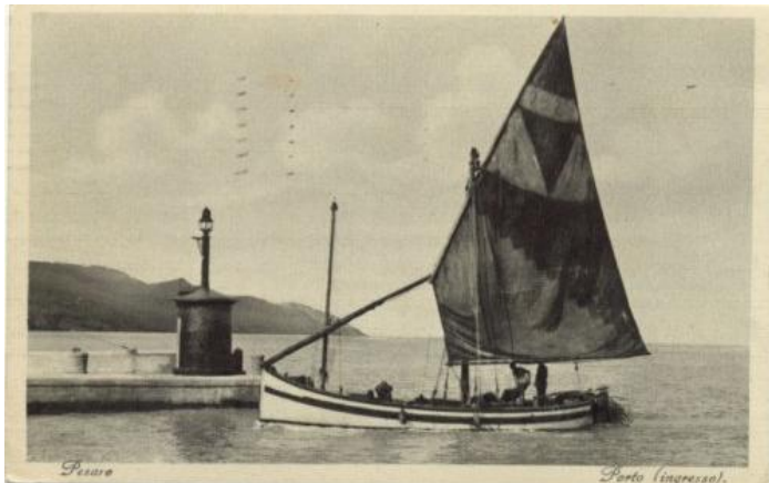
Pesaro - Porto (ingresso)